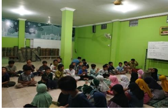
Gambar 1. Kegiatan Pembelajaran di TPQ Al-Hidayah

Jika melihat kondisi tersebut, hal tersebut akan berdampak pada efektivitas proses belajar-mengajar, di mana banyak santri yang tidak diperhatikan secara maksimal. Serta kegiatan belajar mengajar yang cenderung monoton seperti duduk, membaca iqra', dan hafalan. Dan kurangnya media pendukung atau pendekatan bermain yang dapat meningkatkan minat anak-anak dalam mengikuti kegiatan TPQ. Melalui pendekatan Participatory Action Research (PAR), melalui wawancara peneliti bersama pengurus TPQ mengidentifikasi terkait dengan sejumlah faktor yang menyebabkan kurangnya partisipasi remaja. Di antaranya adalah terkait dengan kesibukan pendidikan formal, kurangnya pemahaman akan pentingnya kontribusi sosial-keagamaan, serta belum adanya wadah pembinaan yang mendorong keterlibatan aktif remaja dalam kegiatan keagamaan, khususnya pada kegiatan TPQ.