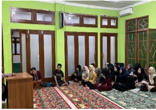
Gambar 2. Langkah 1: Kegiatan Sosialisasi

Setelah melakukan kegiatan sosialisasi dengan anggota remaja masjid, dilanjutkan dengan kegiatan pelatihan dasar mengajar yang berlangsung selama dua hari, yakni pada akhir pekan, untuk menyesuaikan dengan jadwal mereka. Sebanyak 12 remaja mengikuti pelatihan ini secara penuh. Materi pelatihan terbagi dalam tiga sesi. Pertama, teknik dasar pedagogik, meliputi cara mengelola kelas anak-anak, membuat suasana belajar yang menyenangkan, dan mengenali gaya belajar santri usia dini. Kedua, sesi metode pengajaran iqra' dan tajwid, yang difokuskan pada teknik membaca yang benar, membetulkan bacaan anak-anak dengan lembut, serta peneliti juga mengajarkan sekaligus mengecek bacaan al quran serta hukum-hukum tajwid kepada remaja masjid. Dalam sesi ini, peserta juga diajak untuk mempraktikkan secara langsung simulasi mengajar di hadapan rekan sesama peserta. Ketiga, sesi tentang pendekatan psikologis dan spiritual, yang membahas bagaimana membangun hubungan emosional antara mentor dan santri, mengenali karakter anak, serta menjaga semangat spiritual para mentor agar tetap istiqamah dalam mengajar.