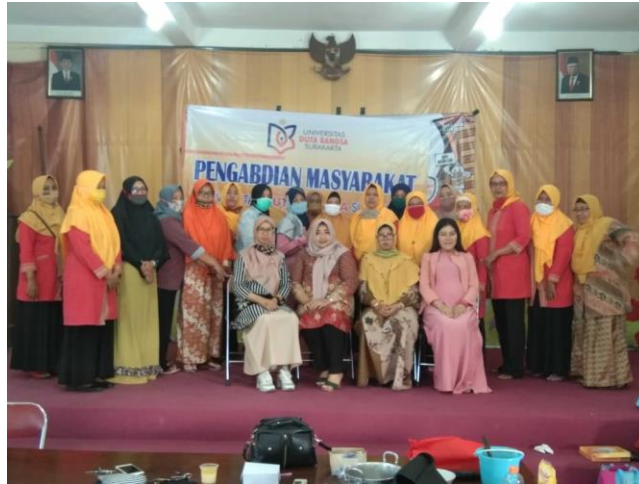
Gambar 2. Foto Bersama Ibu-Ibu PKK

Jumlah peserta dalam kegiatan ini sebanyak 25 orang perempuan yang merupakan ibu rumah tangga aktif dan anggota PKK di Desa Wangen. Peserta menunjukkan antusiasme yang tinggi selama kegiatan berlangsung. Hal ini terlihat dari banyaknya pertanyaan yang diajukan, keterlibatan dalam diskusi kelompok, serta kesiapan mereka untuk mengadopsi nilai-nilai etis dalam bermedia sosial. Para peserta juga menyampaikan bahwa materi yang disampaikan mudah dipahami karena dikemas dengan contoh konkret dari kehidupan sehari-hari.