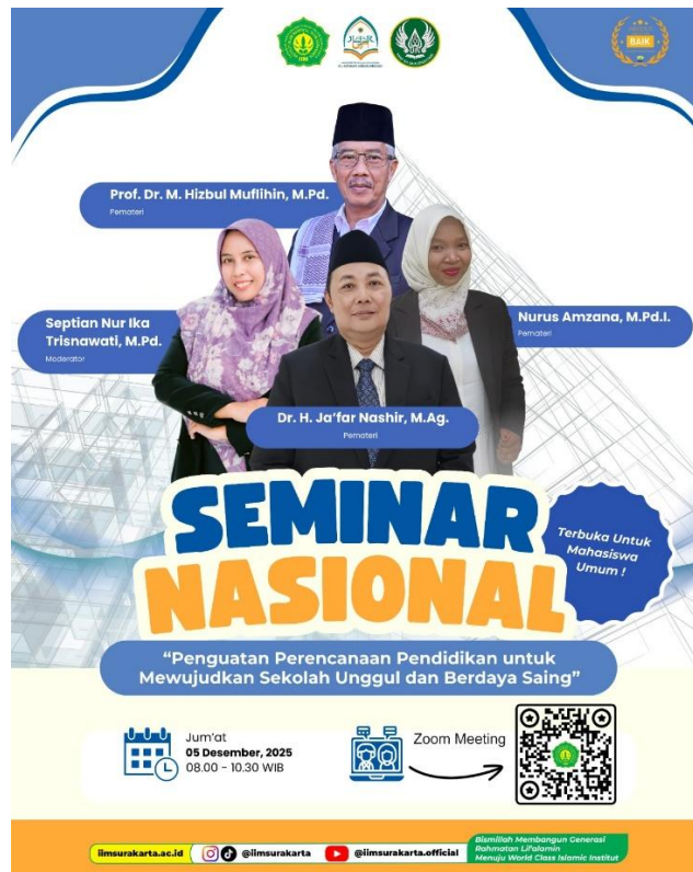
Gambar 1. Profil Kegiatan

Kegiatan berlangsung dengan pola pemaparan materi dan diskusi. Berdasarkan dinamika forum, peserta menunjukkan antusiasme tinggi melalui partisipasi aktif dalam sesi tanya jawab yang berfokus pada problematika perencanaan sekolah, penyusunan program prioritas, serta strategi menghadapi tuntutan perubahan kebijakan dan kompetisi sekolah. Respons dan kualitas pertanyaan peserta menunjukkan adanya peningkatan kesadaran kritis terhadap pentingnya perencanaan pendidikan sebagai instrumen pengendali mutu sekolah.